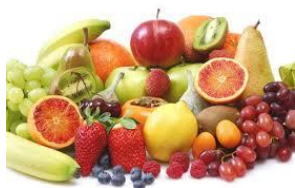
Acidi della frutta