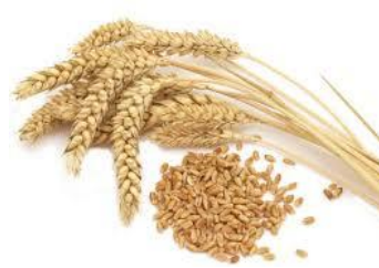
Olio di germe di grano