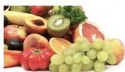
Vitamina C stabilizzata