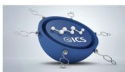
Intelligent care system