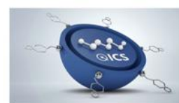
Intelligent care system