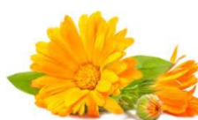
Mucillagine di calendula