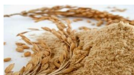
Olio di Crusca di Riso