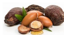
Olio di Argan