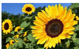
Olio di girasole