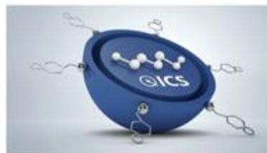
Intelligent care system