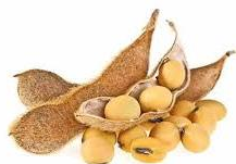
Olio di soia