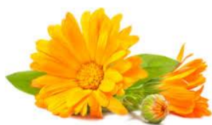
Mucillagine di Calendula