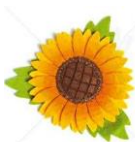
Olio di girasole