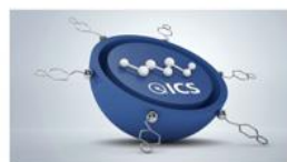
Intelligent care system