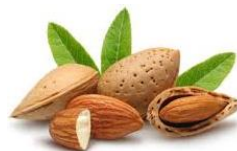
Olio di mandorle dolci