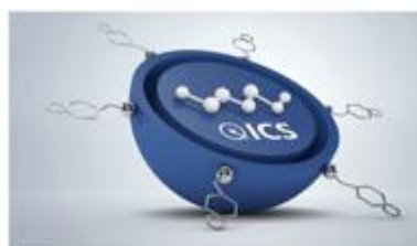
Intelligent care system