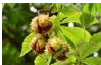
Estratto di ippocastano