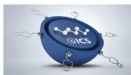
Intelligent care system