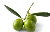
Olio di oliva