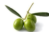
Emulsionante a Cristalli Liquidi