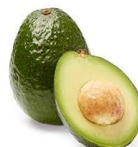
Olio di Avocado