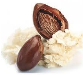
Burro di karitè