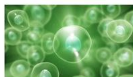
Cellule native vegetali